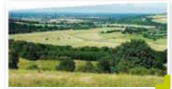
Aide aux plantations subvention du département