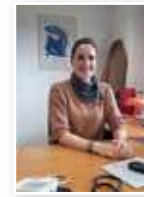
Une infirmière en pratique avancée