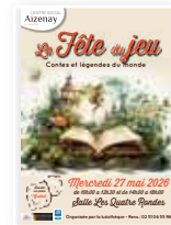
La Fête du jeu