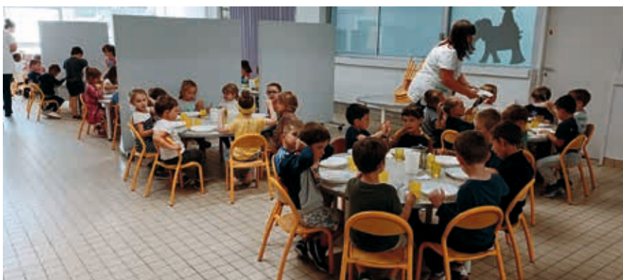
Service de restauration - Maternelles école Louis Buton (Année scolaire 2022-2023).