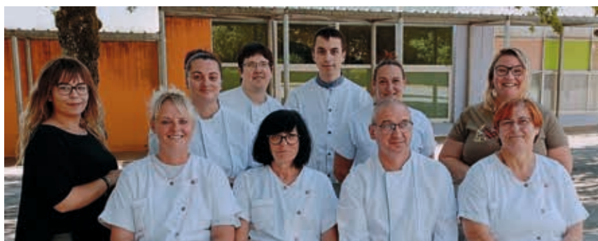
Équipe du restaurant scolaire Louis Buton élémentaire (Année scolaire 2022-2023).

d'agents travaillant au sein de l'unité de production (cuisine), d'ATSEM, d'animateurs et d'agents de service, sur les sites des écoles de Louis Buton et de la Pénrière. Une partie de l'équipe est