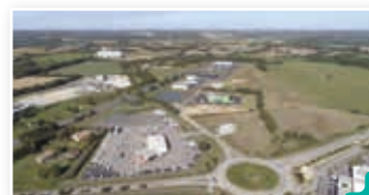
L'espace Vie Atlantique Nord site "clés en main"