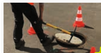
Géoréférencement des réseaux