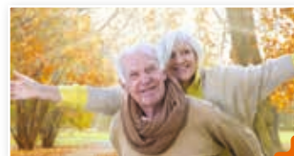
La Semaine Bleue