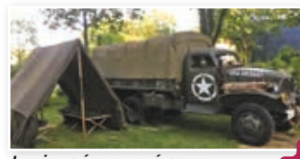
Les journées européennes du patrimoine