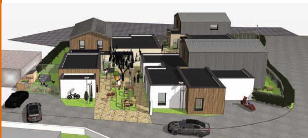
Les trois bâtiments sont dotés de panneaux photovoltaïques et d'une ossature bois.

Ce projet est totalement inédit puisque chaque maison comprendra un studio (25 m 2 ) dédié aux personnes accueillies, un espace réservé aux familles accueillantes et un espace de vie commun pour les repas notamment. Chaque famille accueillera 2 à 3 personnes handicapées.