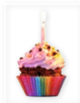
Le pôle culturel 1 an déjà