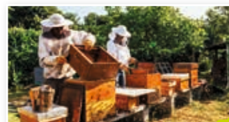
Déclarez vos ruches