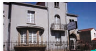
La Sittelle, la tête dans les étoiles