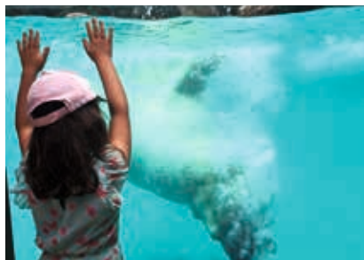
Visite du zoo de la Flèche

CENTRE SOCIAL, ASSOCIATIF ET FAMILIAL MOSAÏQUE