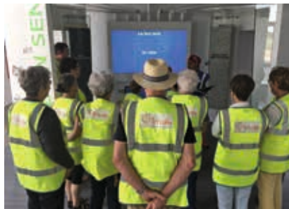
Visite du centre de tri Trivalis.