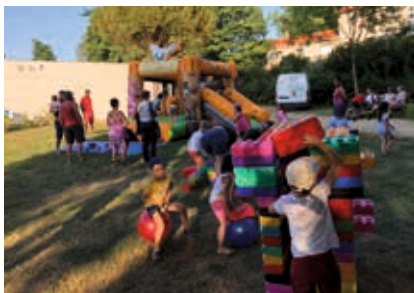
Soirée MARDYnamiques : jeux géants en famille