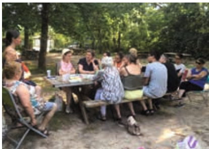
Après-midi "C'est pas Taboo"

Des activités créatives, des visites ludiques ou pédagogiques, des rencontres précieuses : retour en images sur les moments forts du programme d'animations estivales.