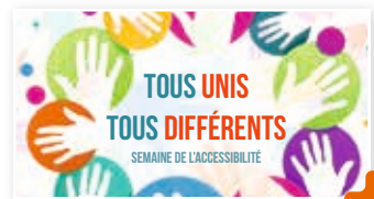
Semaine de l'accessibilité : tous unis, tous différents