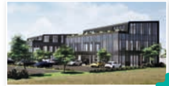
ZA des Centaurées : un nouvel espace tertiaire