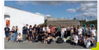
Collège Soljenitsyne : clean up day