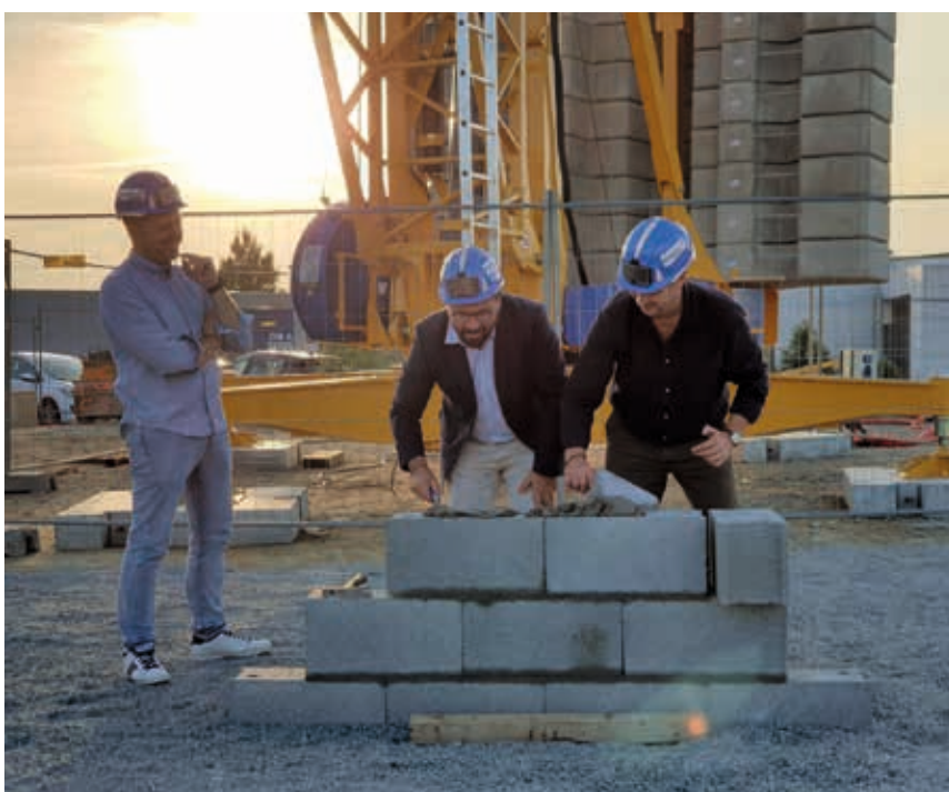
ZA des Centaurées : pose de la première pierre

La livraison est prévue au printemps 2024.