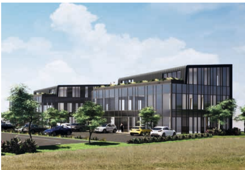
ZA des Centaurées : esquisse du projet