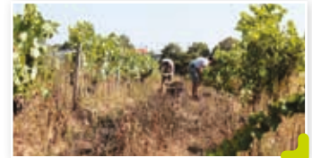
Portrait : Les vignes de l'Atrie