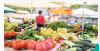
Marché du dimanche matin