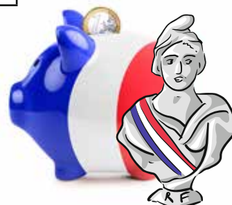
DGF / habitant