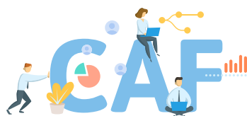
CAF nette / habitant