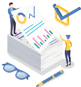
Dépenses de fonctionnement/ habitant

Au niveau de la Capacité d'Auto Financement (CAF) nette et de l'endettement, Aizenay se trouve dans les moyennes des 2 strates : il convient de maintenir ce niveau.