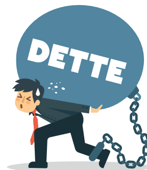
Encours dette / habitant