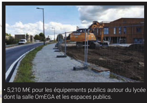
• 5,210 M€ pour les équipements publics autour du lycée dont la salle Oméga et les espaces publics.