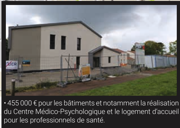
• 455 000 € pour les bâtiments et notamment la réalisation du Centre Médico-Psychologique et le logement d'accueil pour les professionnels de santé.