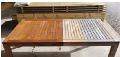
Donner une deuxième vie à vos bois d'extérieur

L'entreprise apporte un service sur-mesure en rénovation et entretien du bois.