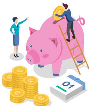
Recettes de fonctionnement / habitant