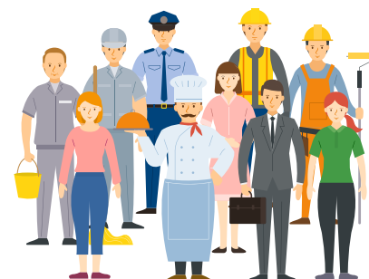
Charges de personnel/ dépenses réelles de fonctionnement