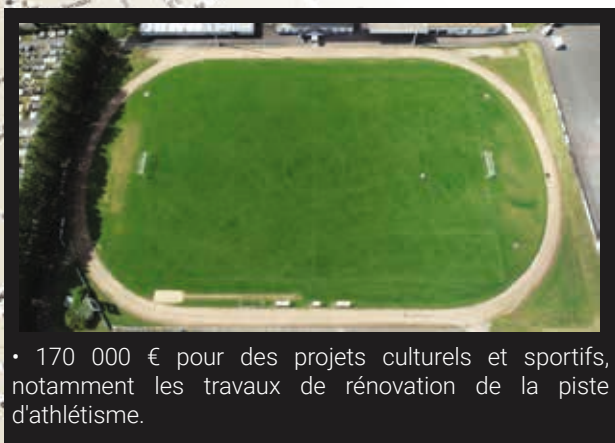
• 170 000 € pour des projets culturels et sportifs, notamment les travaux de rénovation de la piste d'athlétisme.