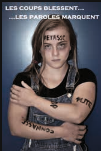
Réalisé par les jeunes de l'Antenne Jeunesse