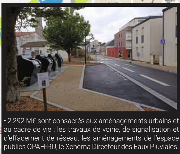
• 2,292 M€ sont consacrés aux aménagements urbains et au cadre de vie : les travaux de voirie, de signalisation et d'effacement de réseau, les aménagements de l'espace publics OPAH-RU, le Schéma Directeur des Eaux Pluviales.