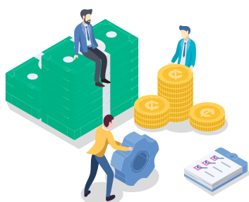
Produits de la fiscalité / recettes réelles de fonctionnement