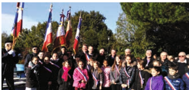
Cérémonie du 11 novembre Les anciens combattants et les membres du CME se sont rassemblés pour commémorer le 101 e anniversaire de l'Armistice