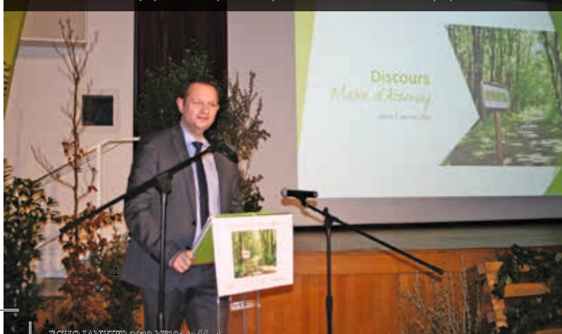
Cérémonie des vœux Le Maire et l'équipe municipale ont présenté leurs vœux à la population.