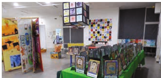
Salon d'Automne L'exposition des enfants