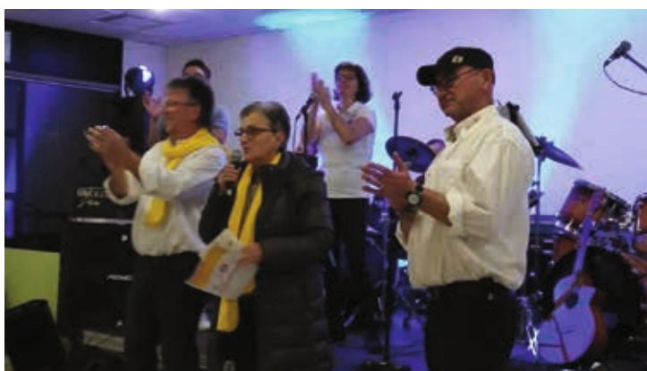
Eclats de Rocks a mis le feu avec une soirée spéciale Johnny.