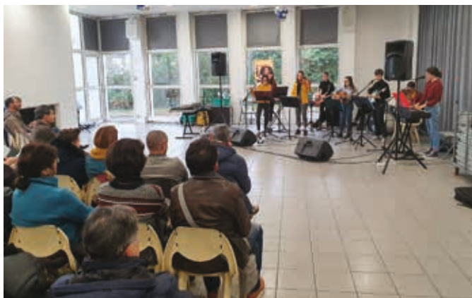
Concert de l'orchestre de jeunes de l'école de musique.

La participation de tous a permis de récolter plus de 7 000 € (contre plus de 5 300 € l'année dernière) qui viendront grossir la collecte nationale en faveur de la recherche sur les myopathies.