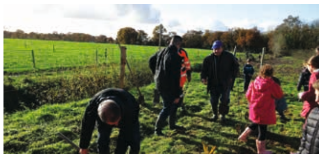
Opération 8000 arbres Le 29 novembre, les enfants des écoles (CE2) et de l'IME ont participé à l'opération "8000 arbres" organisée par la mairie.