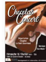
Chocolat Concert 13e édition