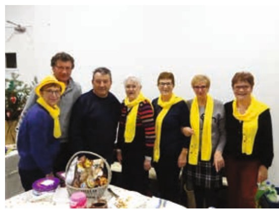
L'équipe du Conseil des Sages à la vente du panier garni et des gaufres.