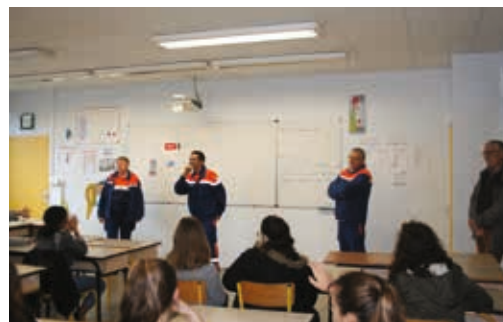
Atelier de la Protection Civile d'Aizenay : Comment alerter ?

Cette action a touché 240 élèves de 4 e et 3 e du collège privé Sainte-Marie d'Aizenay et 130 élèves de 4 e du Collège Alexandre Soljenitsyne.