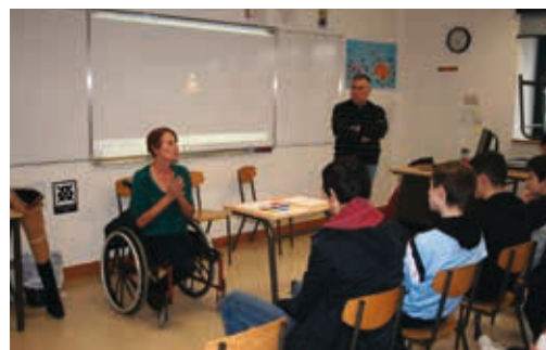
Témoignage d'une victime d'un accident de la route