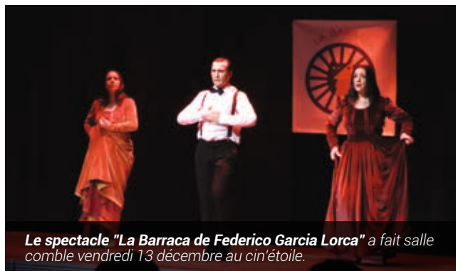
Le spectacle "La Barraca de Federico Garcia Lorca" a fait salle comble vendredi 13 décembre au cin'étoile.