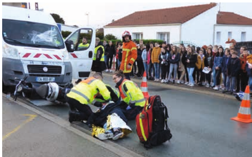
Simulation d'accident devant le collège Sainte-Marie