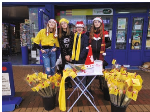
Objectif pour les jeunes de l'antenne jeunesse : vendre 500 roses au profit du téléthon.