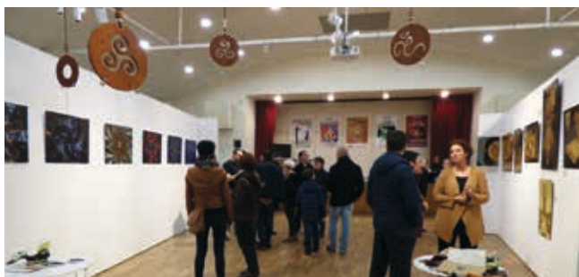
Salon d'Automne L'exposition collective