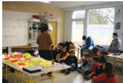
Atelier défi photo avec le Centre Social Mosaïque