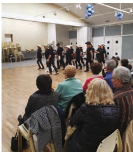
Démonstration de danses country avec Country Show Forever.