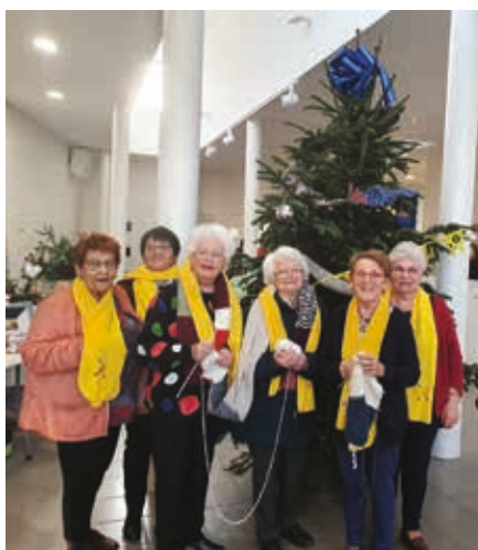
Les tricoteuses de "Loisirs et créations".