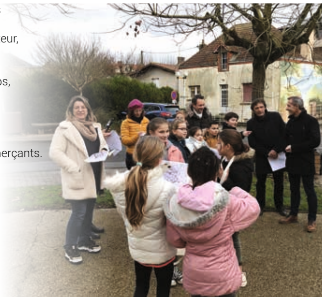
Même les élus du Conseil Municipal des Enfants participent à la réflexion.

Dans un second temps, ces données seront travaillées avec les habitants, les responsables associatifs, les commerçants.