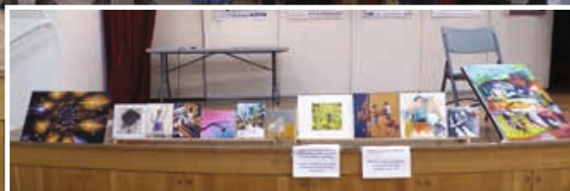
Salon d'Automne La vente au public des œuvres réalisées en direct a permis de récolter 520 € au profit de l'association Clowns et Vie.