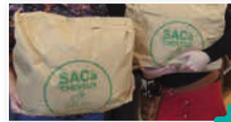
CoiffAmbiance s'engage pour la planète