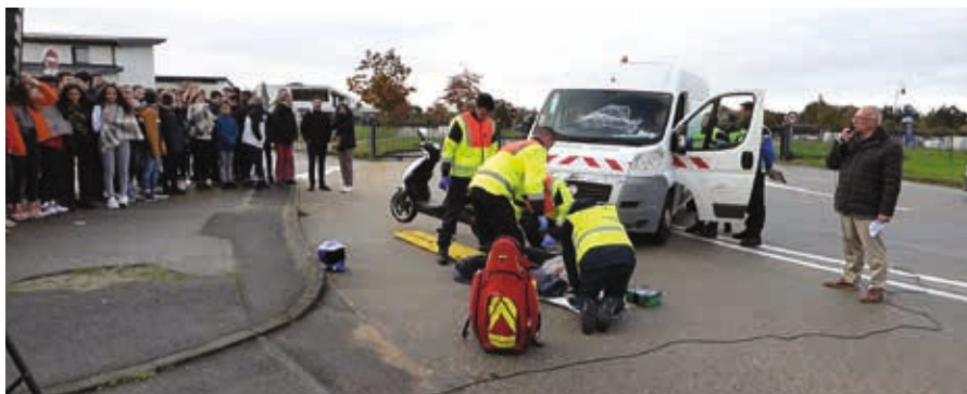
Simulation d'accident devant le collège Alexandre Soljenitsyne

Dans ce cadre, les 7 et 8 novembre 2019, le Conseil Local de Sécurité et de Prévention de la Délinquance (CLSPD) de la Ville d'Aizenay est intervenu dans les collèges pour un temps fort sécurité routière.